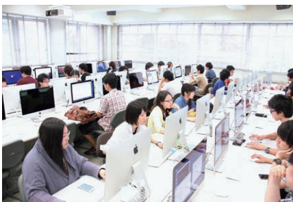
【プログラミング実習の様子】

人間情報工学コースでは、ヒトを中心とした情報処理システムの開発を通して、地域社会の課題を解決し新たな価値を創造するための教育研究を行います。