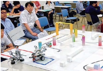
【創造工房実習（2年次）での競技会の様子】

電気電子工学コースでは、発電や蓄電技術、電子デバイス技術、情報通信技術、制御技術を通じて、社会に役立つ技術開発能力を身につける教育研究を行います。