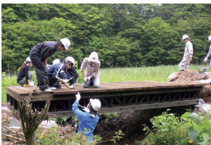
【オンサイト木橋の施工を手伝う学生たち】

土木環境工学コースでは、自然環境・社会環境に配慮した社会基盤の整備・維持・管理や安全・安心・快適な地域環境の創造・保全についての教育研究を行います。