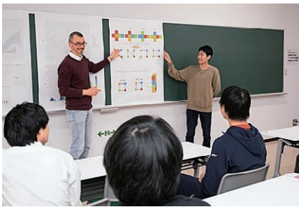
【勉強成果を発表するセミナーの様子】

数理科学コースでは、数理科学の理論と応用を学び、社会の諸問題の解明に活用したり、高等学校教員（数学）・中学校教員（数学）となり地域の理数系教育の向上に貢献するための教育研究を行います。