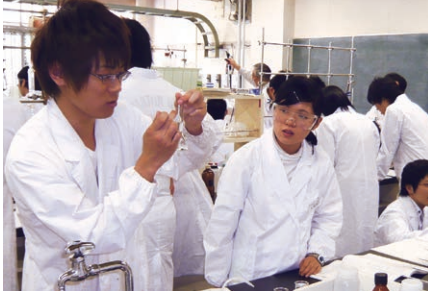
【ホールピペット、ビュレットを用いた分析化学実験（2年次）の様子】

応用化学コースでは原子・分子レベルの化学から、化学を活かしたものづくりまでをカバーした教育研究を行います。 天然および人工の無機材料、有機材料、エネルギーに関連した化学工学からバイオプロセスまで幅広い化学の専門分野を学びます。