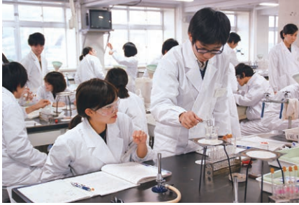
【基礎化学実験（1年次）の様子】

生命科学コースの教育プログラムでは、化学と生物学を中心とした広範かつ先端の知識と研究技術が習得可能です。