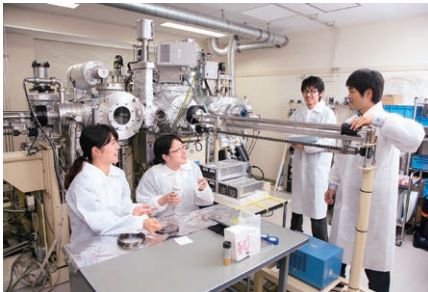
【磁性薄膜を作製するための準備の様子】

材料工学コースでは、金属、セラミックス、半導体をベースに材料物性の微視的発現機構を探索しながら、生産プロセスの技術開発を実現するための教育研究を行います。